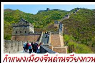
กำแพงเมืองจีนด้านจวิ้นกวน

UNIVERSAL STUDIO BEIJING DISNEYLAND SHANGHAI รถไฟความเร็วสูง - ถ่ายรูปห่อไข่มุก กำแพงเมืองจีนด้านจวิ้นกวน บ๊อพิเศษ เปิดปักกิ่ง, สุกี่หม้อไฟ BUFFET