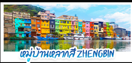
หมู่บ้านหลากสี ZHENGBIN

เสริมบารมี ขอพร "เทพเจ้ากวางอู๋" ณ วัดเว่ยเทียน เสริมอำนาจ การงาน เปิดดวงโชคลาภ "เจ้าแม่มาจู่" วัดชางชานซือโฮ่ว วัดที่มีดวงจуйดีที่สุดในไทเป TAIPEI 101 เซ็นทรัลพลาซ่า ลานกิจกรรมแห่งไต้หวัน • ถ่ายรูปที่หมู่บ้านหลากสี จิวเฟิน สัมผัสบรรยากาศโรงน้ำชาชุดคลาสสิก • ปั่นจักรยานช้อปปิ้ง (4 ท่า/โคม) แหล่งรวมแฟชั่นและของกิน ย่านซีเหมินติง • ตลาดกลางคืนเกาหยวน ตลาดไถหนาน รวมร้าน MICHELIN GUIDE มากที่สุดในไต้หวัน