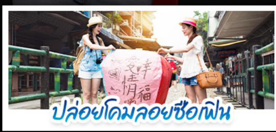
ปล่อยโดมลอยซื้อก๊อฟิน