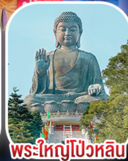
พระใหญ่โป่วหลิน