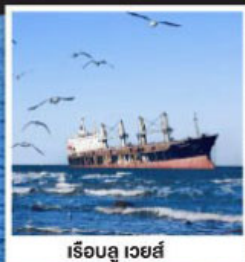
เรือลู เวยส์