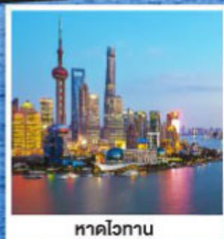
หาดไว่กาน