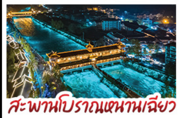
สะพานโบราณเขานางฟ้า