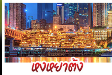
แสงเซาตั้ง