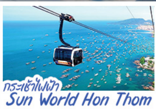
กระเช้าไฟฟ้า Sun World Hon Thom