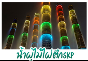
น้ำพุไม้ไผ่ตักSKP