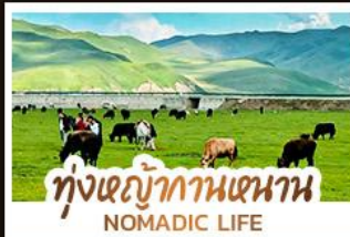
ทุ่งหญ้ากานหนาน NOMADIC LIFE