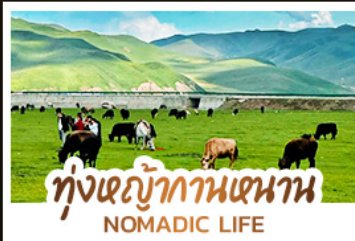
ทุ่งหญ้ากานหนาน NOMADIC LIFE