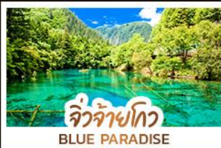
จิวจ้ายโกว BLUE PARADISE