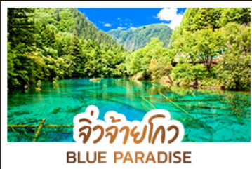
จิวจ้ายโกว BLUE PARADISE