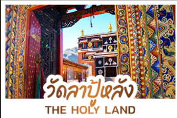
วัดลาปูหลง THE HOLY LAND

หนึ่งศรัทธา: สัมผัสความสงบและสถาปัตยกรรมทิเบตที่ วัดลาปูหลง หนึ่งผืนหญ้า: ล่องลอยไปในความเขียวจีของ ทุ่งหญ้ากานหนาน หนึ่งสายน้ำ: ค้นพบความงามเหนือกาลเวลาที่ จิวจ้ายโกว