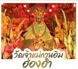
วัดเจ้าแม่กวนอิมอ่องฮ่า