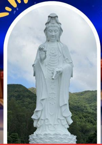
วัดซีซัน