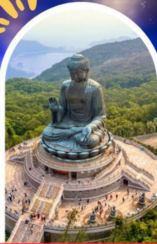
นั่งกระซ้านองปิง