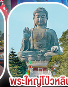
พระใหญ่โป้วหลิน