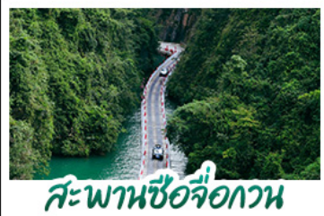
สะพานซื่อจื่อกวน