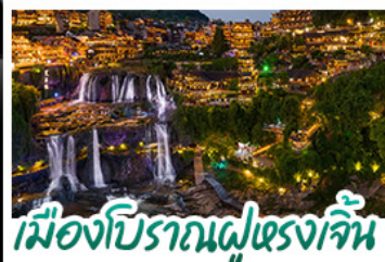
เมืองโบราณฝูหลงเจิน