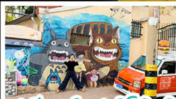
สตรีทอาร์ต สตุตโตอิจิบลิ