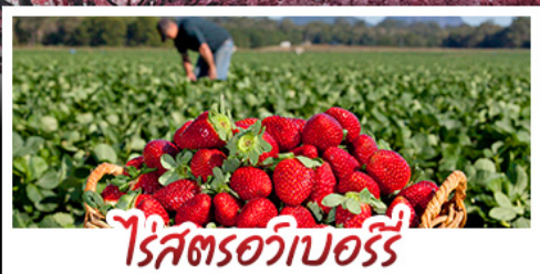
ไร่สตรอเบอร์รี่

คฤหาสน์หวินเล็ง - สวนซากุระซิงเต่า ไร่สตรอเบอร์รี่ - ไร่เบียร์ซิงเต่า