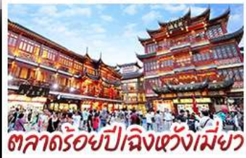
ตลาดร้อยปีฉิงหวังเหมียว