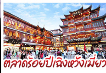
ตลาดร้อยปีฉิงหวังเมี่ยว