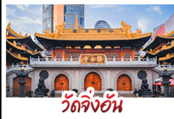
วัดจิ่งอัน