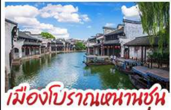
เมืองโบราณหนานชุน

DISNEYLAND SHANGHAI เต็มวัน เมืองโบราณหนานชุน (รวมล่องเรือ) - วัดจิ่งอัน เมืองโบราณหนานชุน - ตลาดร้อยปีฉิงหวังเหมียว มือพิเศษ บุฟเฟ่ต์ BBQ, เสี่ยวหลงเปา