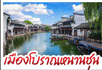
เมืองโบราณหนานชุน

DISNEYLAND SHANGHAI เต็มวัน เมืองโบราณหนานชุน (รวมล่องเรือ) - วัดจิ่งอัน เมืองโบราณหนานชุน - ตลาดร้อยปีฉิงหวังเมี่ยว มือพิเศษ บุฟเฟ่ต์ BBQ, เสี่ยวหลงเปา