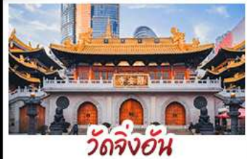
วัดจิ่งอัน