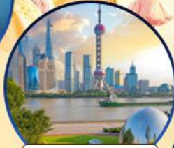
นอร์ทปิ่น กรีนแลนด์