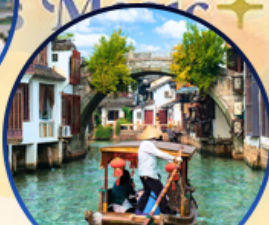
เมืองโบราณจูเจียเจีย