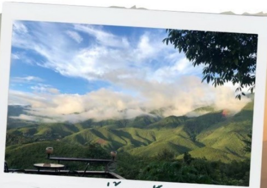
หมู่บ้านสะปัน