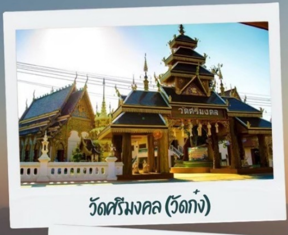
วัดศรีมงคล (วัดก่ง)