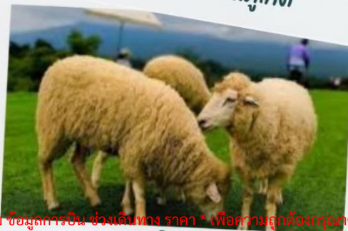
ฟาร์มแกะ