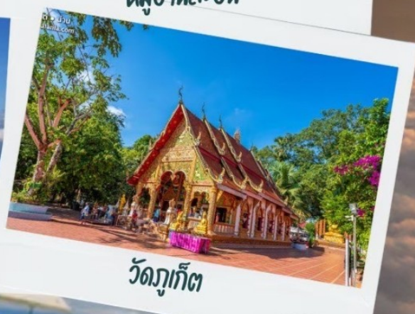
วัดภูเก็ต