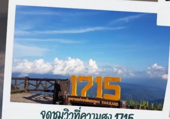
จุดชมวิวที่ความสูง 1715