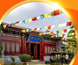
วัดก่วงเหริน