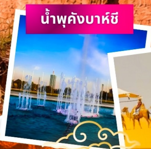
น้ำพุคังบาหีซี