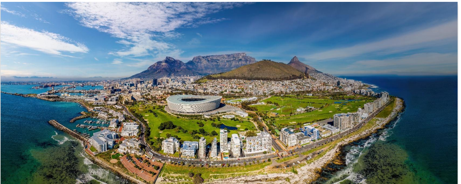
CAPE TOWN SOUTH AFRICA

01.00 น. ออกเดินทางสู่ กรุงไนโรบี ประเทศเคนย่า เที่ยวบินที่ KQ887 06.05 น. เดินทางถึงท่าอากาศยานนานาชาติไนโรบี (แวะเปลี่ยนเครื่อง) 07.25 น. นำท่านออกเดินทางสู่ สนามบินนานาชาติเคปทาวน์ ประเทศแอฟริกาใต้ โดย สายการบิน Kenya Airways เที่ยวบินที่ KQ792 เดินทางเหนือระดับด้วยบริการระดับเว็ลด์คลาสตลอดเส้นทาง 13.35 น. เดินทางถึง สนามบินนานาชาติเคปทาวน์ ประเทศแอฟริกาใต้ นำท่านผ่านขั้นตอนการตรวจคนเข้าเมืองและพิธีการทางศุลกากร และนำท่านขึ้นรถโค้ชเพื่อเดินทางสู่ เคปทาวน์ Cape Town เมืองท่องเที่ยวชื่อดังของประเทศแอฟริกาใต้ South Africa โดดเด่นด้วยทัศนียภาพอันงดงามของภูเขาและท้องทะเล ผสานกับวัฒนธรรมที่หลากหลายได้อย่างลงตัว ตั้งอยู่บริเวณปลายแหลมทางตอนใต้ของประเทศ จึงมีภูมิอากาศแบบเมืองตากอากาศที่สดชื่นตลอดปี นอกจากนี้ยังเป็นที่ตั้งของแหลมสำคัญที่มีชื่อเสียงระดับโลก อาทิ แหลมกู๊ด