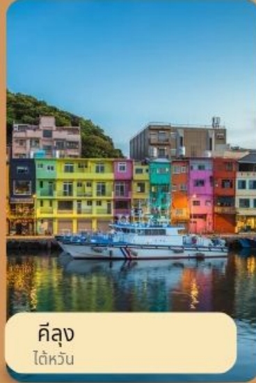
ค็ลุง ไต้หวัน