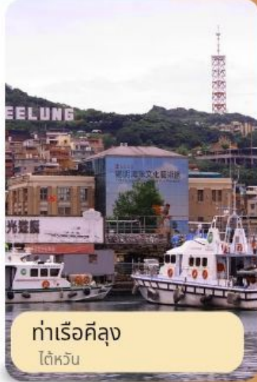
ท่าเรือค็ลุง ไต้หวัน