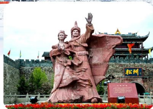
เมืองโบราณซงพาน

เมนูพิเศษ สุกี้หม่าล่า บุฟเฟต์ ดันตำรับเสฉวน 6 วัน 5 คืน เดินทาง : ธ.ค. - ปีใหม่ 68