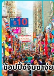
ช้อปปิ้งจิมซาจอย