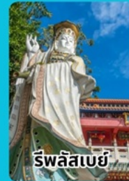
ริฟลิสเบย์