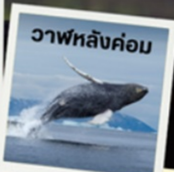
วาฬหลังค่อม