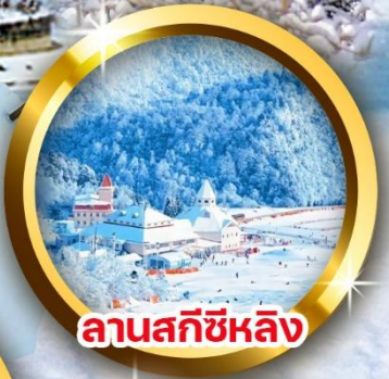
ลานสกีซีหลิง