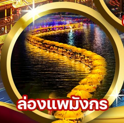
ล่องแพมังกร