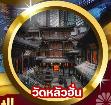
วัดหลิวอัน