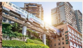
รถไฟฟ้ากะลุ่ตึก

*ทางบริษัทฯ ขอสงวนสิทธิ์ในการสลับโปรแกรมทัวร์ตามความเหมาะสมขึ้นอยู่กับสถานการณ์หน้างาน โดยคำนึงถึงผลประโยชน์ของลูกค้าเป็นสำคัญ