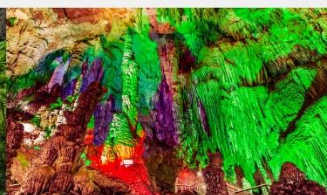
กำแพงหงตั้ง