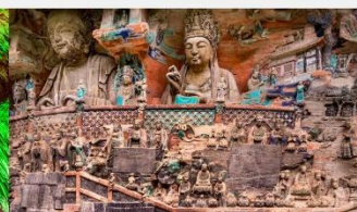
ผาหินแกะสลักต้าจู่ เป่าติงซาน