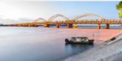
สะพานชงฮวาเจียง