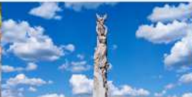
สวนประติมากรรมโลกฉางซุน