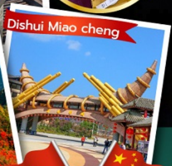
Dishui Miao cheng