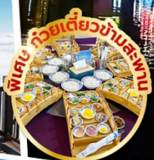
พิเศษ ภัตตาคารอาหาร