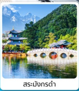
สระมิงกรต้า