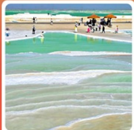
ทะเลสาบเกลือจาเอ๋อทาน

ไฮไลท์! กำแพงเกาหลู กำพุธรศิลป์โบราณ มรดกโลก UNESCO ภูเขาสายรุ้งจางเย่ ภูเขาหินสีส้มแปดตา หนึ่งในภูมิประเทศที่แปลกที่สุดในโลก