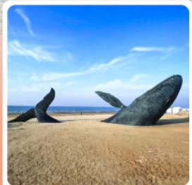
วาฬผู้โดดเดี่ยว