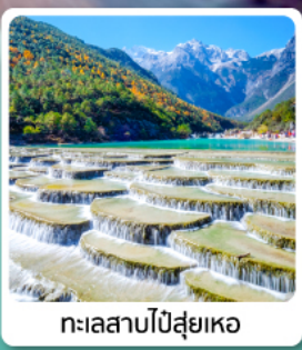
ทะเลสาบโป๋ส่วยเหอ