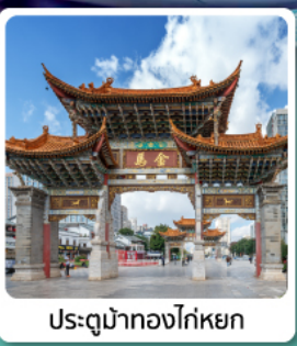
ประตูน้ำทองโก่หยก