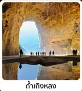
ถ้ำถึงหลวง