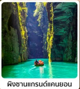
ผิงซานแกรนด์แคนยอน