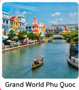
Grand World Phu Quoc