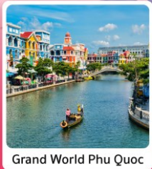
Grand World Phu Quoc