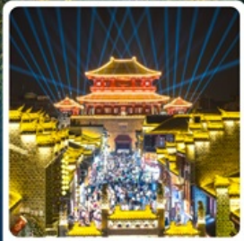
เมืองโบราณเซียงหยาง