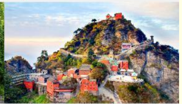
อุทยานเขาวู้ต้ง

*ทางบริษัทฯ ขอสงวนสิทธิ์ในการสลับโปรแกรมทัวร์ตามความเหมาะสมขึ้นอยู่กับสถานการณ์หน้างาน โดยคำนึงถึงผลประโยชน์ของลูกค้าเป็นสำคัญ