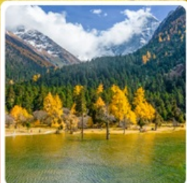
อุทยานแห่งชาติปี้เฟิงโกว