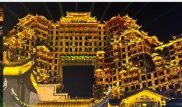
ตีทมหัตศวรรษ 72