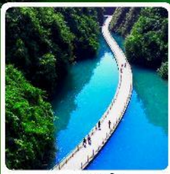
หุบเขาสิงโต

• ไฮไลท์ อุทยานเทียนเหมินซาน ประตูสวรรค์ ตึกมหัศจรรย์ 72 หมู่บ้านโบราณฟูรงเจิน ภูเขาไร่ชาอู่เจียโต อุทยานสื่อจื่อกวนด่านสิงโต