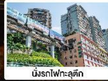
นังสหน้ก-อูตัก