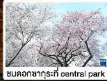
ชมดอกซากุระที่ central park