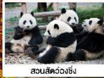
สวนสัตว์ฉงชิ่ง