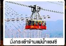
นั่งกระเช้าข้ามแม่น้ำแยงซี

พร้อมมื้ออาหารกลางวันพิเศษ! แบบเปิดปิกนิก