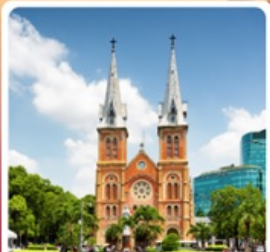
โบสถ์นอร์ทเทรอดาม

• โฮโลก!! นั่งรถจี๊ปสุดมันส์ ตะลุยทะเลทรายขาว สนุกสุดเหวี่ยงที่สวนสนุก VinWonders อิสระตามใจ