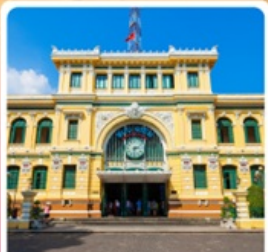
ไปรษณีย์กลางโฮจิมินห์