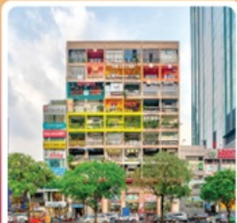
คาเฟ่ อพาร์ทเม้น