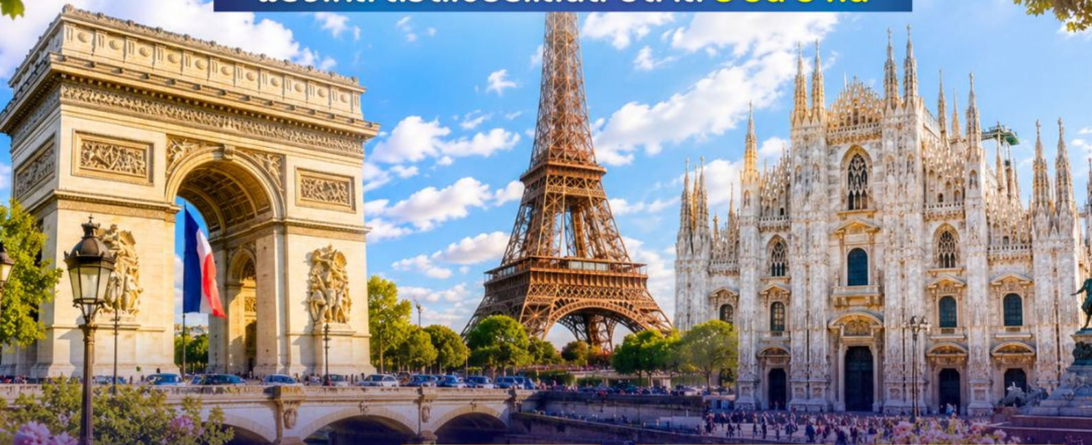
ล่องเรือแม่น้ำแซนส์