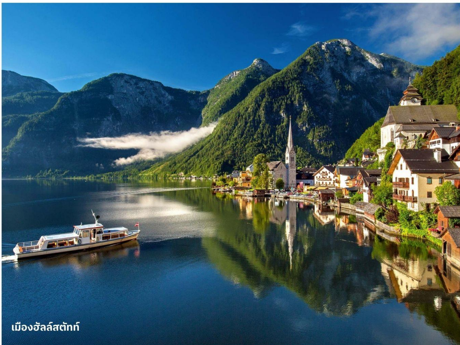
เมืองฮัลล์สตัดท์