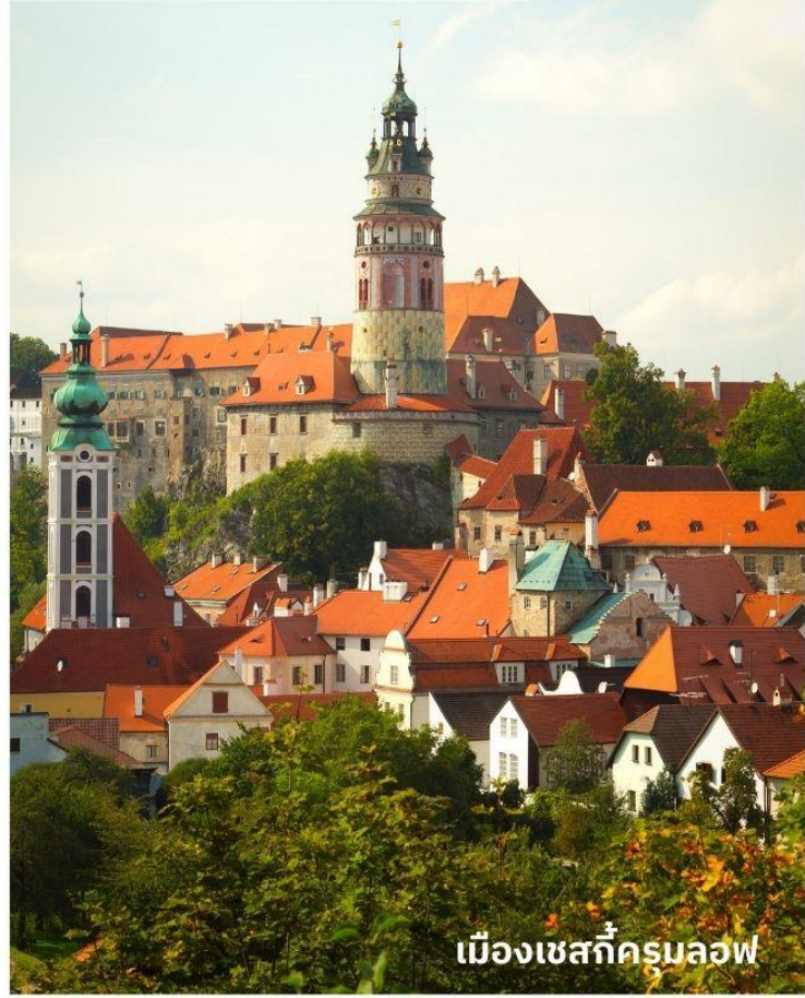
เมืองเชสกีครุมลอฟ

เพราะรถบัสไม่สามารถเข้าไปส่งถึงหน้าโรงแรมได้