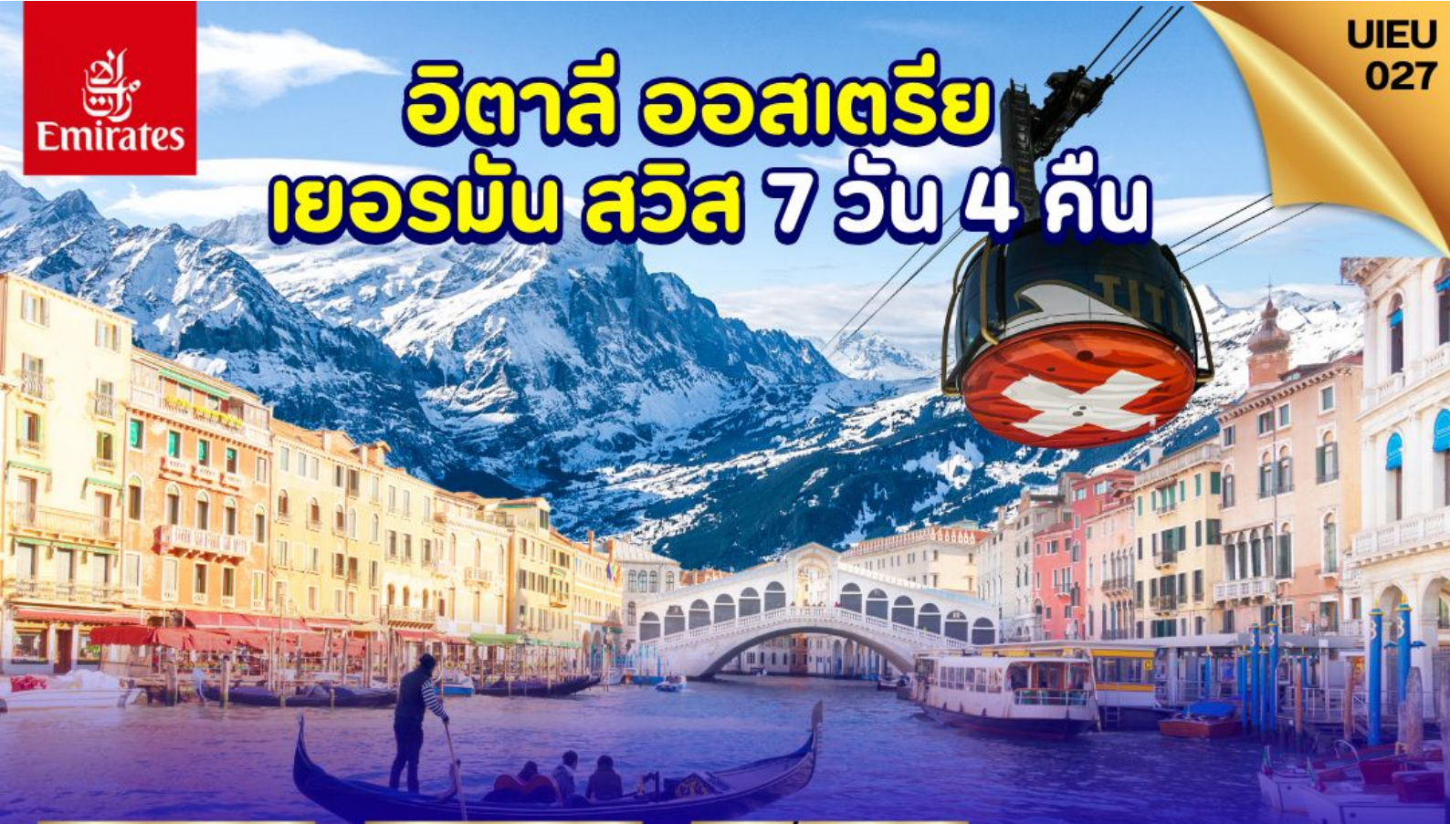
ยอดเขากิตลิส