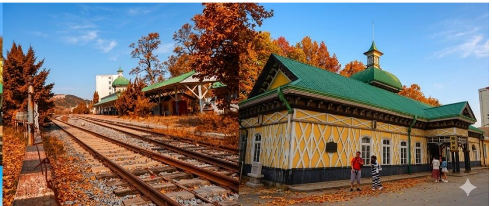
สถานีรถไฟหลี่ซุ่น

นำท่านเที่ยวชมและเก็บภาพ ณ สถานีรถไฟหลี่ซุ่น 旅顺火车站 เป็นสถานีปลายทางของเส้นทางรถไฟสาขา เส้นหยาง - ต้าเหลียน สร้างขึ้นในปีค.ศ. 1903 ออกแบบโดยสถาปนิกชาวรัสเซีย เป็นอาคารอิฐก่อปูนผสม โครงสร้างไม้ตามสถาปัตยกรรมรัสเซีย.