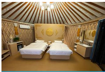
ห้องพักสไตล์มองโกลสมัย