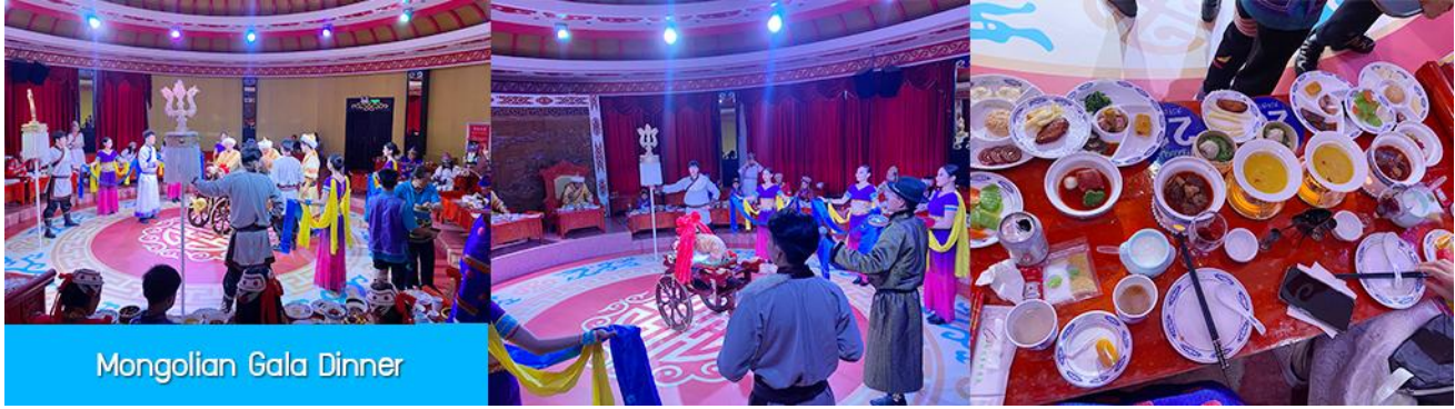
Mongolian Gala Dinner