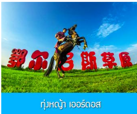
ทุ่งหญ้า เออร์ดอส

พักที่ ORDOS BOYU AIRUI HOTEL โรงแรมระดับ 4 ดาวท้องถิ่น หรือเทียบเท่าในเมืองเออร์ดอส