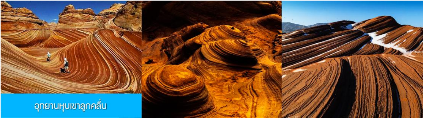
อุทยานหุบเขาอุกถัน