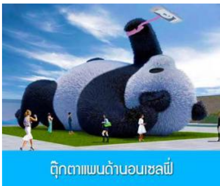
ตุ๊กตาแพนด้าอนเซลฟ์