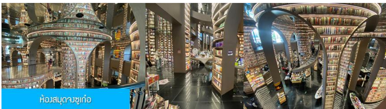
ห้องสมุดจซู่เก๋อ

หลังอาหารนำท่านชม สะพานหนานเจียว 南桥 สะพานโบราณक्रमแม่น้ำตู่เจียงเยียนขึ้นชื่อที่ได้กลายเป็นแหล่งท่องเที่ยวสำคัญและจุดเช็คอินสำหรับนักท่องเที่ยว ในช่วงค่ำที่นี่จะประดับประดาด้วยแสงสี บริเวณริมน้ำจะถูกประดับด้วยแสงไฟสีฟ้าที่ทอดยาวไปตามแนวแม่น้ำ ชาวบ้านตั้งชื่อว่าเป็น น้ำตาสีฟ้า 蓝色眼泪 พักที่ โรงแรม CENTER INTER HOTEL ระดับ 4 ดาวท้องถิ่นหรือเทียบเท่าในเมืองตู่เจียงเยียน