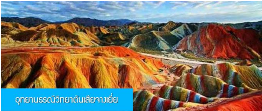
อุทยานธรณีวิทยาตันเสีจางเยี่ย

พักที่ JIN WU INTER HOTEL โรงแรมระดับ 4 ดาวห้องดีน หรือเทียบเท่าในเมืองหวู่เว่ย