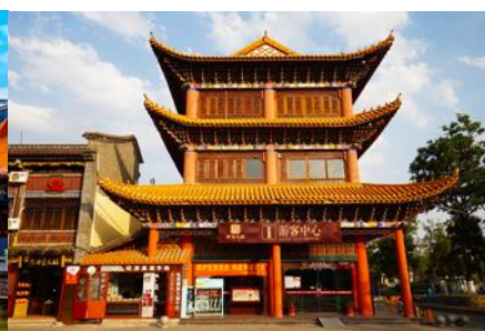
เมืองโบราณกวนตุ๋

วันที่ห้า เมืองต้าหลี่ – เมืองคุนหมิง-วัดหยวนทง-เมืองโบราณกวนตุ๋