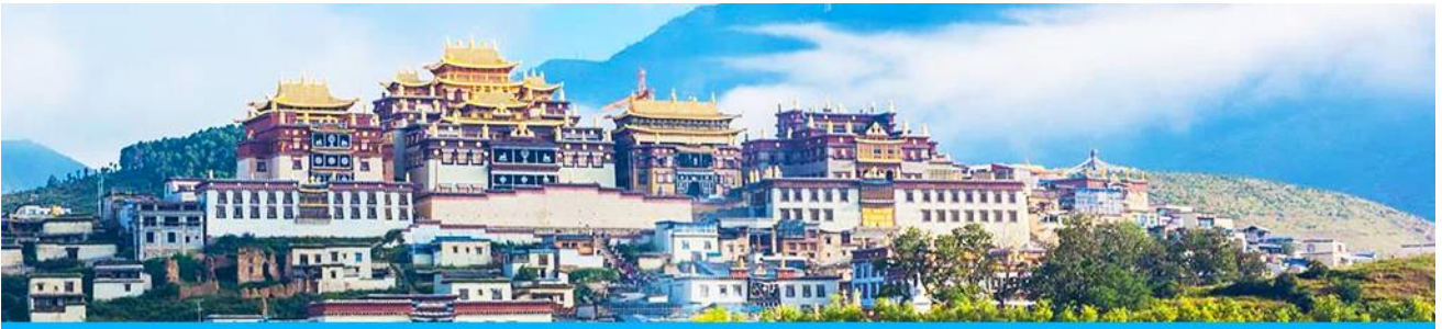
เมืองโบราณแซกริล่า

จากนั้นนำท่านเดินทางสู่ เมืองจงเตียน โดยใช้เส้นทางด่วนวิ่งตรงเข้าเมือง จงเตียน ใช้เวลาเดินทางประมาณ 2 ชั่วโมง สู่ เมืองจงเตียน หรือดินแดนแห่งแซกริล่า ซึ่งอยู่ทางทิศตะวันออกเฉียงเหนือของมณฑลยูนนานซึ่งมีพรมแดนติดกับอาณาเขตน่านซี ของเมืองลี่เจียง และอาณาจักรหยา ของเมืองหนิงหลง สถานที่แห่งนี้จึงได้ชื่อว่า ดินแดนแห่งความฝัน