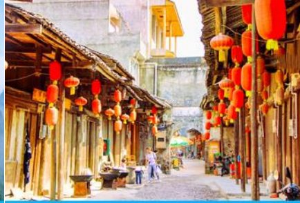
เมืองโบราณต้าชวี