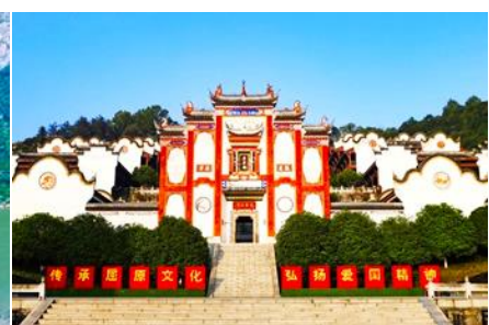
บ้านเกิดกวี ชวีหยวน