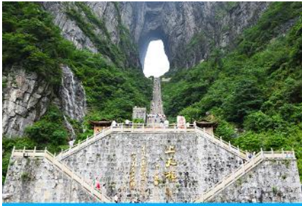
ประตูสวรรค์