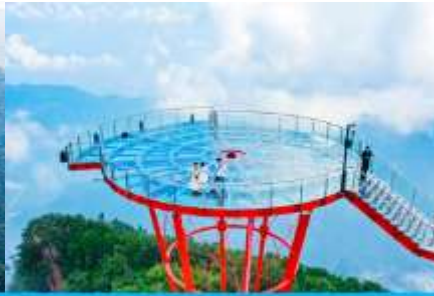
ระเบียงชมวิว Sky Eye