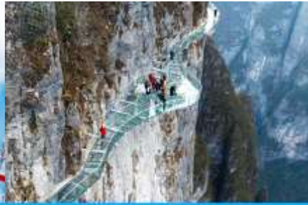
ระเบียงทางเดินเลียบบหน้าผา

วันที่สาม จางเจียเจี้ย-ศูนย์สมุนไพรจีน-ผลิตภัณฑ์ยางพารา- กระเช้าขึ้น/ลงเขาเจ็ดดาว – ระเบียงชมวิว Sky Eye - ระเบียงทางเดินเลียบบหน้าผา – (เลือกซื้อโปรแกรมเสริม โข่วจิ้งจอกขาว)