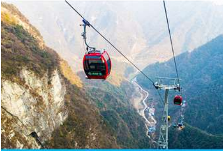
กระเช้าขึ้น/ลงเขาเจ็ดดาว