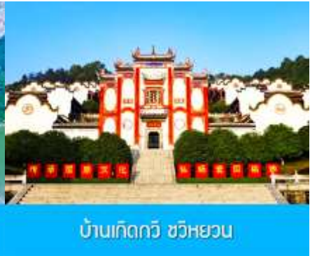
บ้านเกิดกวี ขวี่หยวน