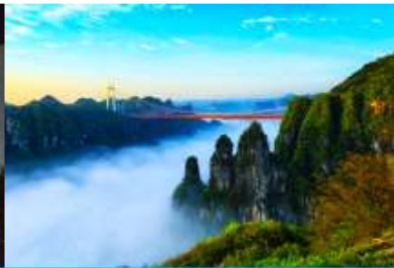
อุทยานป่าไผ่แห่งชาติไ้อ้าย