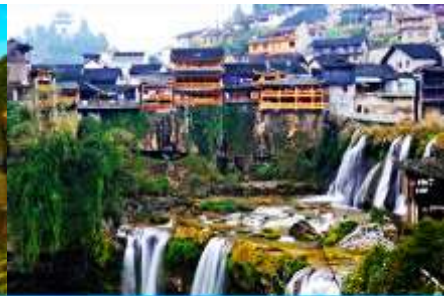
เมืองโบราณผู่หรงจิน